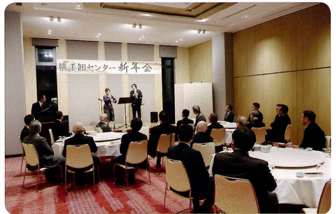
▲会場に響き渡るトランペットの演奏