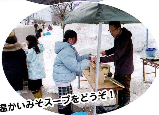
温かいみそスープをどうぞ!