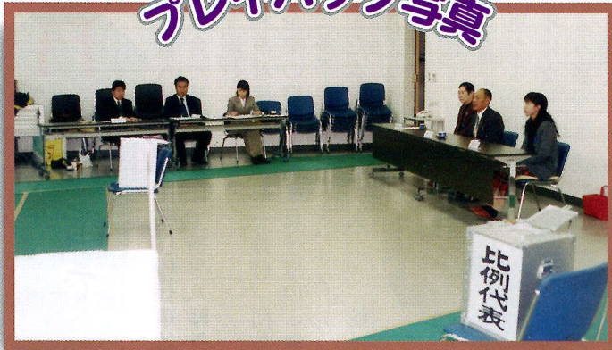
平成15年 衆議院議員選挙より 組合会館が投票所となる

雪が降ってくると、また雪よせや屋根の雪おろしをしなきゃいけないなと憂鬱な気分になる。でも昨シーズンは殆ど降らず、今シーズンも大雪になるとは言われながら、こちら地方はそれ程でもなく体の負担は軽減されている。そのせいなのか体重が3kg程増えている今日この頃、体重計に乗った時には思わず「嘘」と声が出た。確かに思いあたるフシがある。この冬、全然運動らしきものをした事がない。娘夫婦はジムに通っていると聞いたが自分もジムに通いはじめたらいいものか。でも雪が溶ければ、ハードな農作業が休日ごとに待っている。今のところは楽しんでおこう。(米澤)