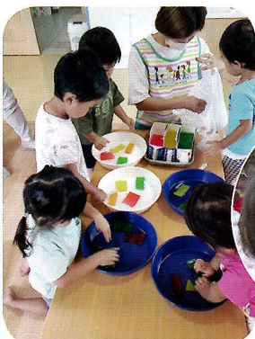
▲寒天でひんやり感触遊び