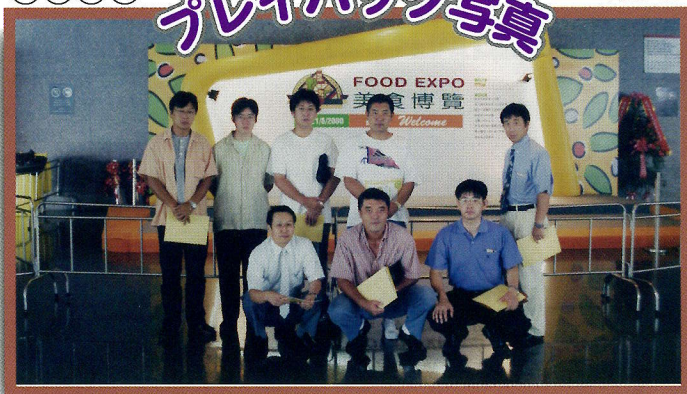
平成12年8月 ビジョン21委員会 海外視察研修in香港

編集委員のひとりごと この度私は、このウィズ通信の取材がきっかけで、居住区の第一号の女性消防団員になりました。初仕事はお盆の祭り会場の巡回。数少ない団員たちは皆、祭の踊り手であり担ぎ手である。私は「巡回くらいならやれます。」と仕事の休みをとって観光客の案内や会場周辺の見回りをしました。 先日の金沢問屋センターの視察旅行時にも当然話題になった【災害時におけるBCP策定】。「災害は…方がどこかすくそばに潜んでいる。昨日」。読んでいるあなた！機能別消防団員になって一緒に活動しませんか？ (和泉)