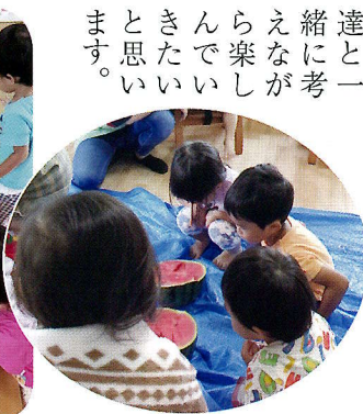
▲楽しいスイカ割り