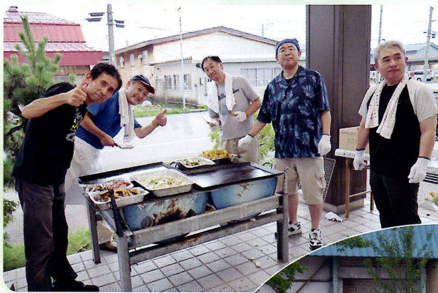
▲厚生委員、頑張ってます！