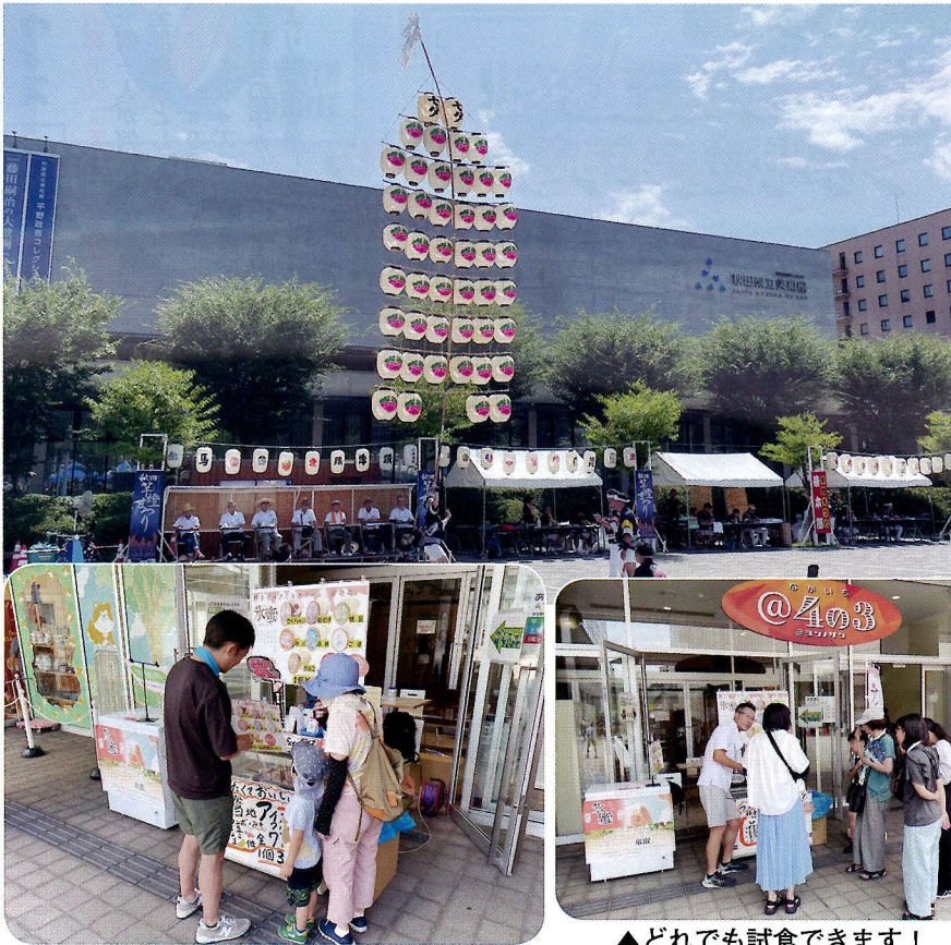
▲種類はこんなにあるんですよ!!

竿灯まつりの開催期間中でもあり秋田駅周辺は県内外から多くの観光客が訪れ、暑い日差しの中、店頭では県産のPRと冷たいアイスの試食に涼を求めるお客様が立ち寄り賑わいました。感想では「甘さが丁度良い」「めずらしい種類」など期間限定のさくらんぼ味や新発売のみそ味が好評で、完売したフレーバーもありお子様から大人の方まで幅広い世代で氷蜜のおいしさを知って頂きました。