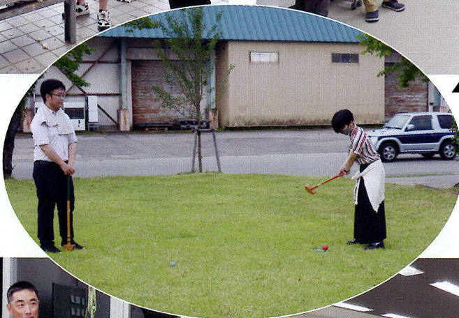
◀狙いを定めてナイスショット！！