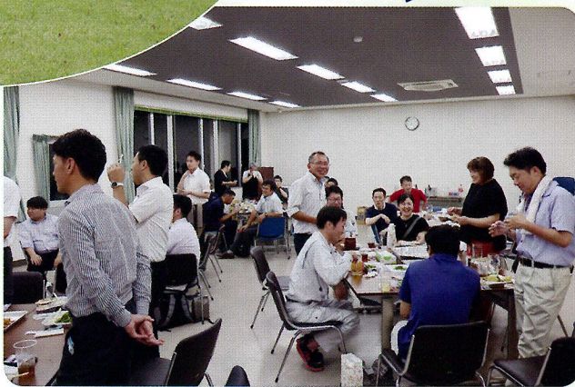
▲ビンゴゲームが中々当たりません…