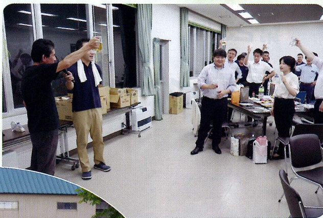
▲理事長の乾杯でパーティ開始！