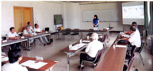
▲とても興味深いお話しでした！

性への寛容が求められる時代です。」とのお話があり、セミナーを通して相互を尊重する大切さを知る機会となりました。